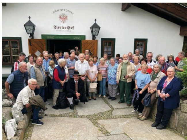
Die Reisegruppe vor dem Tirolerhaus