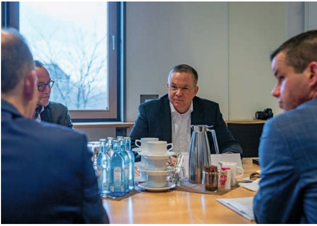
Amtschef Ulf Bandiko im Gespräch mit den Beauftragten für Vertriebene und Spätaussiedler der anderen Bundesländer am 20. November 2025 im Sächsischen Staatsministerium des Innern.

sich neben Ihrem Verband und der Stiftung mit der Kultur der ehemaligen Aussiedlungs- und Vertreibungsgebiete befassen. Praktisch seit Beginn meiner Amtszeit ging es auch immer um die – leider wenigen – Stellen und die Sicherung der Mieten in den Begegnungsstätten sowie die Hilfe für den Spätaussiedlerdachverband, wo wir als Innenministerium sozusagen als Feuerwehr agieren, ohne dass wir als Haus allein die Problematik grundlegend lösen können.