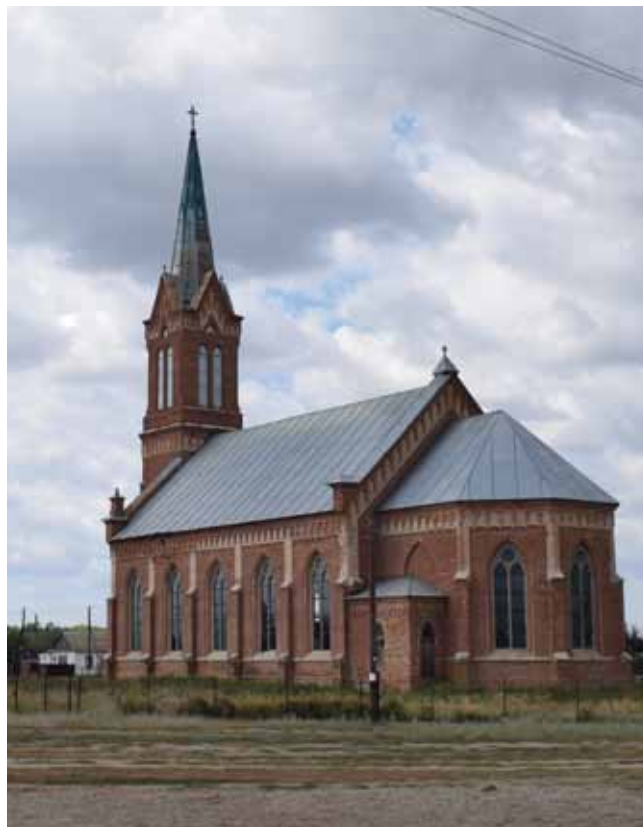
Römisch-katholische Christkönigskirche in Marx