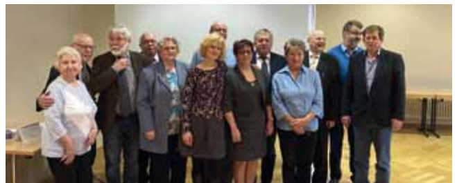
Der erweiterte Landesvorstand