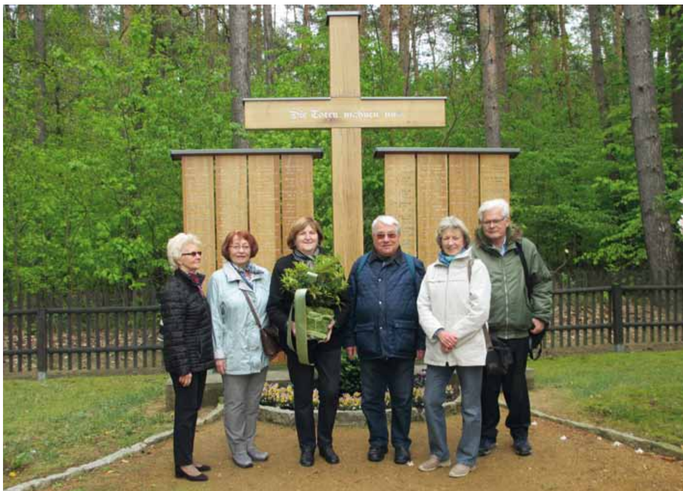
Gedenken auf dem Waldfriedhof am Lilienstein

Es ist für uns ein fester Termin – im Mai besucht unsere Sudetendeutsche Ortsgruppe Dresden den Waldfriedhof am Lilienstein. Es ist eine Tradition für uns noch lebende Sudetendeutsche, zu diesem Waldfriedhof zu fahren. Er liegt am Fuße des Liliensteins und gehört zum Ort Waltersdorf.