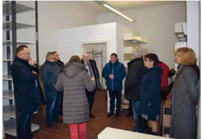
Besichtigung des Bildungs- und Begegnungszentrum Knappenrode