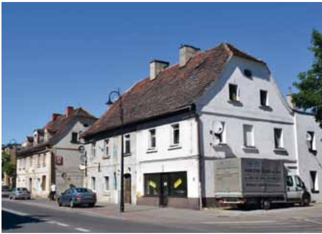
Ehemalige Siedlungshäuser in der Breslauer Straße