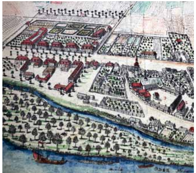
Ansicht des Herrnhuter Viertels in Neusalz um 1774