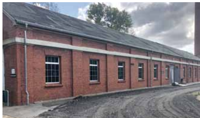
Außenansicht des BBZ Knappenrode

für das BBZ am Ideenwettbewerb zum Strukturwandel Lausitz aus dem Mitmachfonds des Freistaates Sachsen beteiligt. Jetzt heißt es abwarten und hoffen.