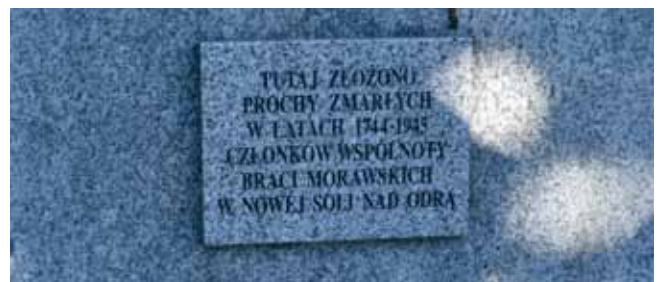
Gedenktafel am Standort des früheren Gottesackers