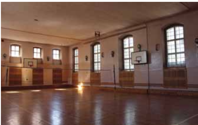
Heutige Nutzung des Kirchensaales als Sporthalle